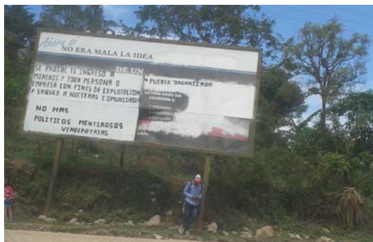
Cartel elaborado por vecinos del lugar.