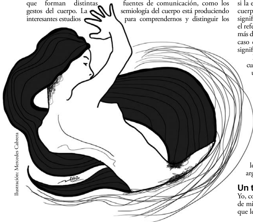
Ilustración: Mercedes Cabrera

Sentir, conocer, reflexionar sobre estas significaciones, hace de la sensualidad un campo único, que se degusta en solitario. Compartir es comprender al otro en la justa dimensión de su forma individual. Por ello, compartirse la intimidad sensual, es una entrega sin palabras, diciendo sensualidades desde lo más hondo del conocimiento personal.