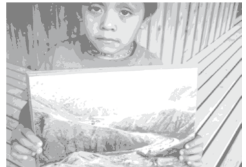
Niño de Río Negro presenta una fotografía histórica de la aldea Panimá, Río Negro, antes de la construcción de la represa.