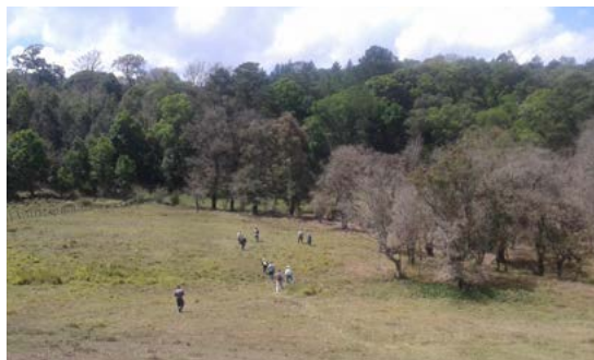
Límite administrativo entre Jutiapa, Jalapa y Santa Rosa, donde está localizada la licencia de exploración Lucero.

En los próximos meses se estará desarrollando una consulta de vecinos en el municipio de San Carlos Alzatate, departamento de Jalapa, ya que la población teme la expansión de la mina San Rafael porque está vigente la licencia de exploración Lucero en su territorio.