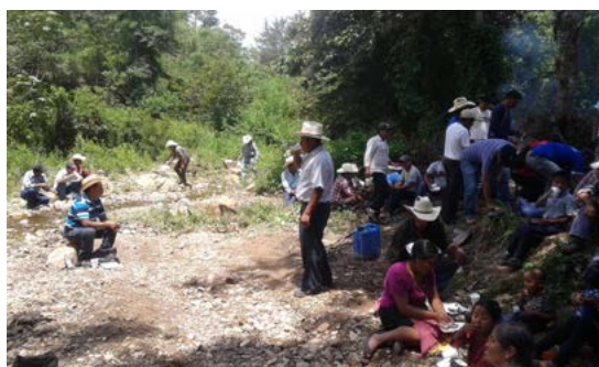
Reunión de comunidades para intercambiar información y hacer acuerdos sobre la preparación de la consulta.