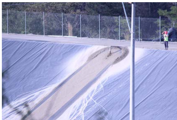
Dique de colas