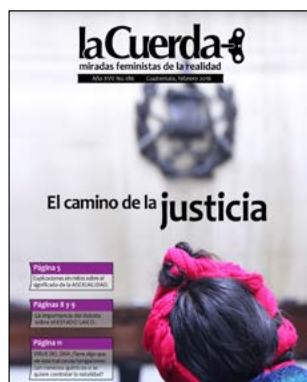
En portada: Mercedes Cabrera