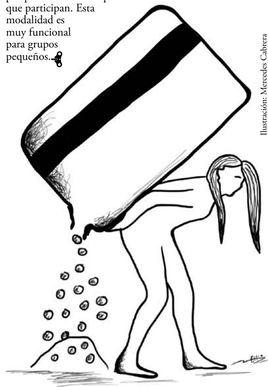
Ilustración: Mercedes Cabrera

cantidad fija, mes a mes se rotan -según esté estipulado- para recibir el monto que se acumula por parte de todas las personas que participan. Esta modalidad es muy funcional para grupos pequeños.