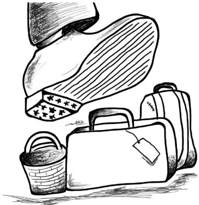
Ilustración: Mercedes Cabrera

http://www.guatemala.gob.gt/index.php/noticias/item/1192-presidente-jimmy-morales-destaca-avances-en-democracia-y-lucha-contra-la-corrupcion-en-guatemala Luis Solano. "Alianza para la prosperidad, Un proyecto de la elite empresarial", en Plaza Pública , Guatemala, 6 de marzo 2015, en https://www.plaza-publica.com.gt/content/un-proyecto-de-la-elite-empresarial