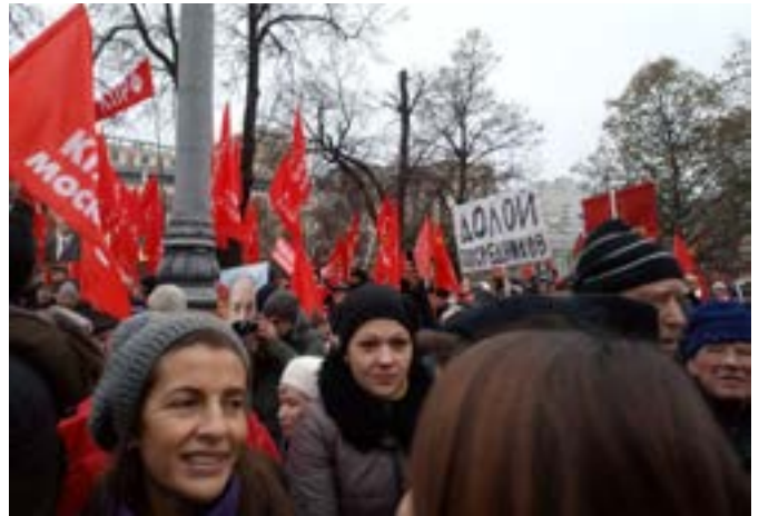
Mujeres participan en una marcha como parte de los festejos del Centenario de la Revolución Rusa en la ciudad de Moscú, el 7 de noviembre de 2017.

Lograr la igualdad de mujeres y hombres fue posible tras largas discusiones y propuestas de teóricos bolcheviques y marxistas, pero ante todo por la labor diligente de la comunista Aleksandra Kollontai , la primera mujer que ocupó un puesto en el gobierno y quien tras sus conversaciones con la alemana socialista Clara Zetkin en 1906, se convenció de la necesidad de organizar a las mujeres y de transformar las relaciones burguesas de la familia.